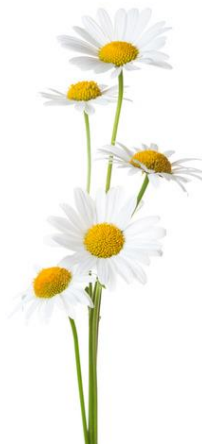
Flours de camomille