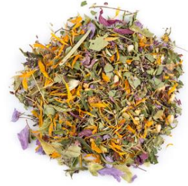
Mélange de plantes déshydratées