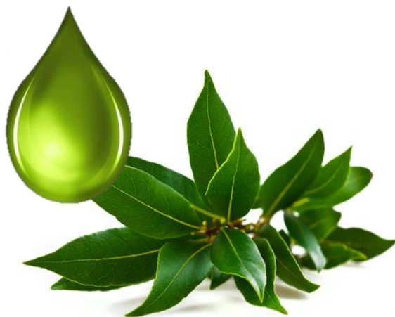
Huile de laurier